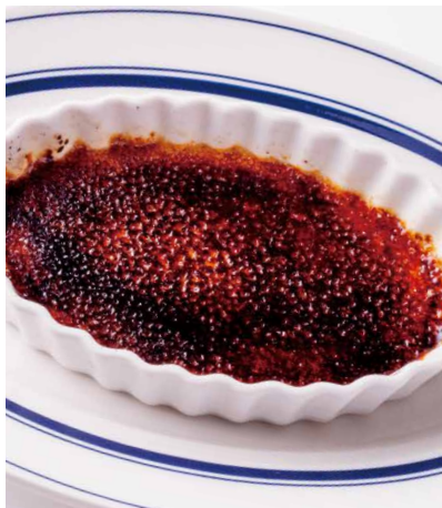
クレームブリュレ