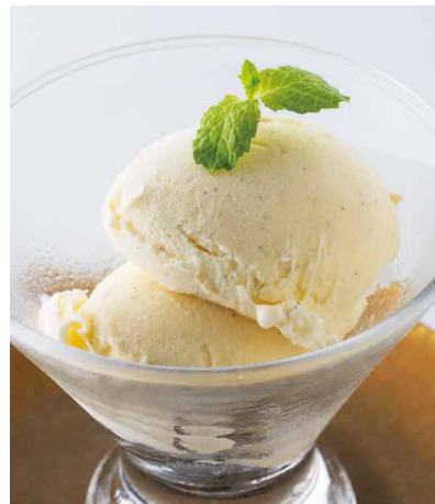
バニラアイス 又は 季節のアイス