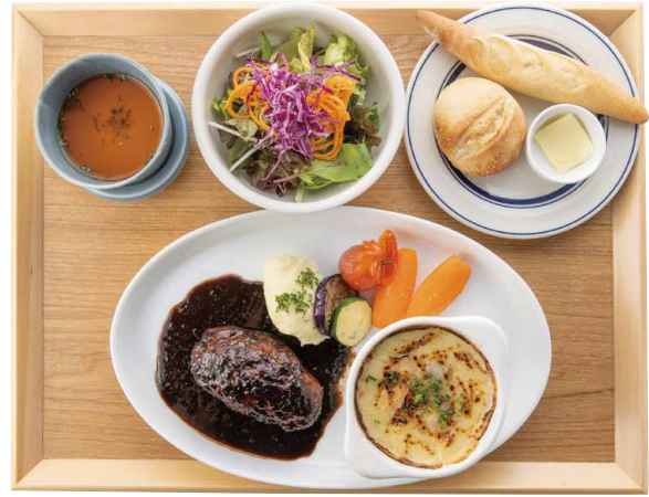
洋食屋さんのチキンクリーム グラタンと特選デミグラスソースハンバーグ