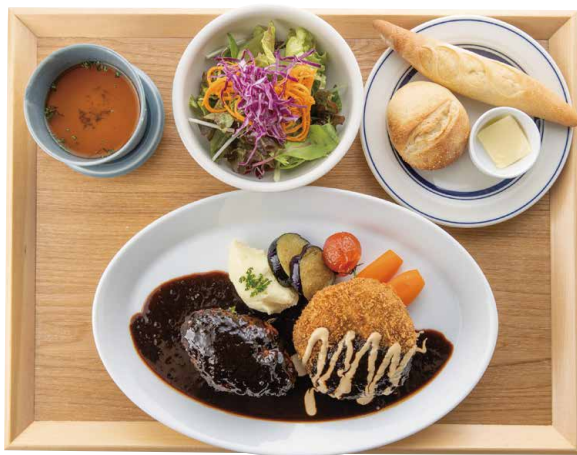
メンチカツと 特選デミグラスソースハンバーグ