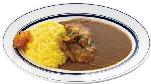
ガンジーチキンカレー

オリジナルに独自で配合したスパイスとフレンチの 技法を取り入れたスペシャルカレーです。