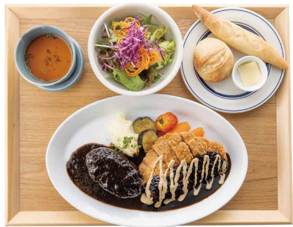
天草ポークのカツレツと 特選デミグラスソースハンバーグ