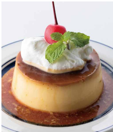
クラシックプリン