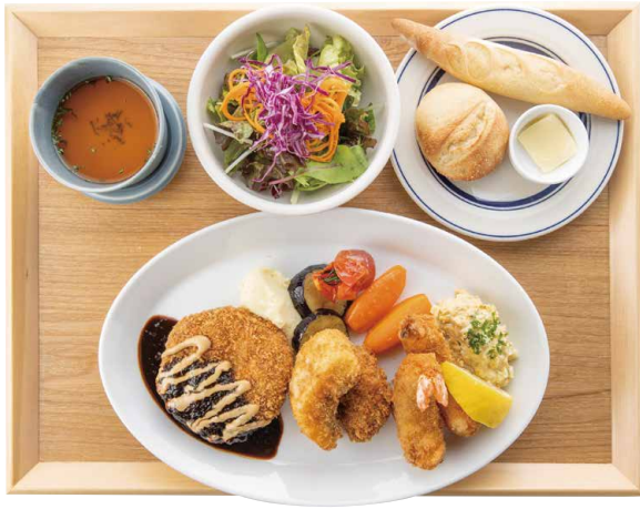
洋食屋さんの 王様ミックスフライ