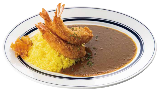
ガンジーエビフライカレー