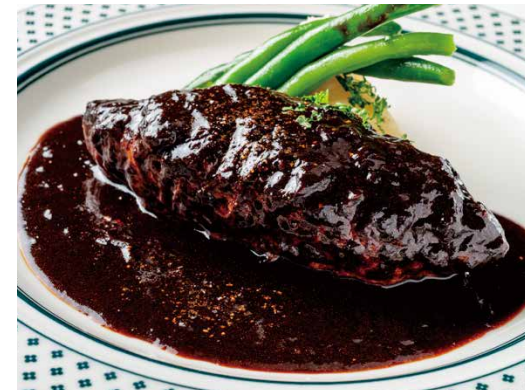
上野洋食遠山 特選デミグラスソースハンバーグ ¥1900