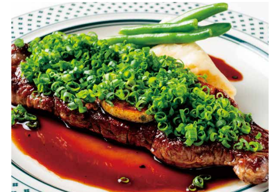
特選牛サーロインステーキ レモンソース ¥2000