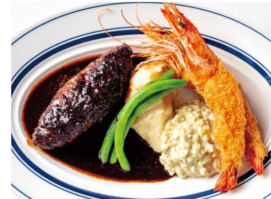
大エビフライ & 特選デミグラスソースハンバーグ ¥2500